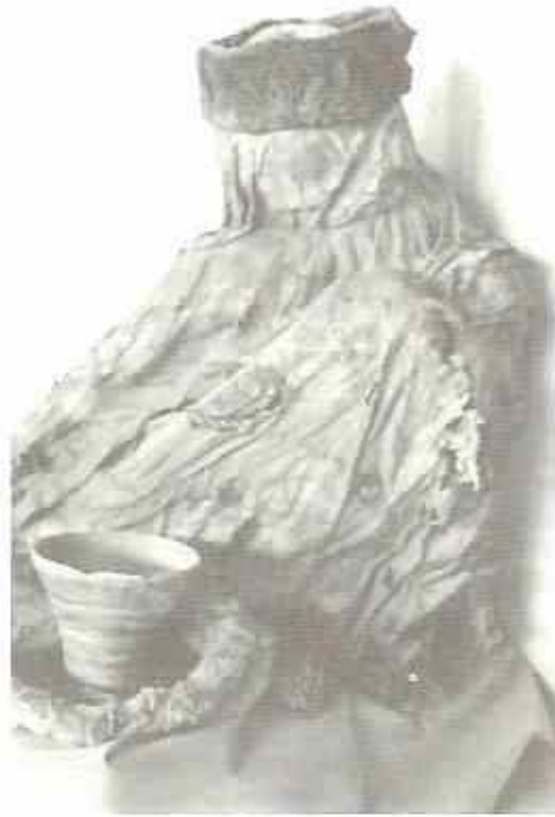
COYO ORIENTE, Tumba 4129