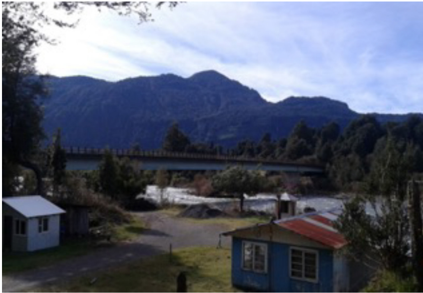
Figura 2. Sector Gol Gol. Descripción: sector de residencia de María.