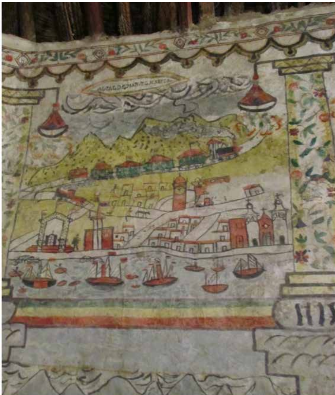
Imagen 2. Fragmento de pintura en la iglesia de Sabaya, 1892 (foto de la autora, Sabaya, 2012).

comunidades de Carangas seguían vinculándose activa y simbólicamente con el Pacífico. Los puertos, ferrocarriles y banderas pintados en el baptisterio de Sabaya en 1892 evocan un mundo comunitario que busca dar continuidad a sus relaciones contestadas con el Pacífico (Medinaceli, 2016).