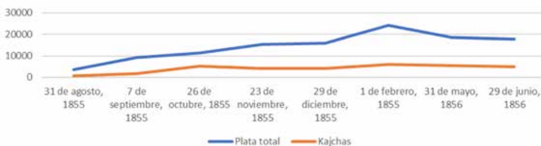
Gráfico 1. K'ajcha vs. plata total mandada al Banco de Rescate de Potosí. 1855-1856.

Afortunadamente, se conserva gran parte de la correspondencia de Gregorio Pacheco, uno de los comerciantes más importantes del sur de Bolivia en las décadas de 1840 y 1850, quien además fue uno de los mayores contrabandistas de plata. Pacheco se convertiría eventualmente en uno de los mineros más ricos de Bolivia y en uno de sus presidentes más exitosos. Gobernó entre 1884 y 1888 durante un período en que la oligarquía minera había arrebatado