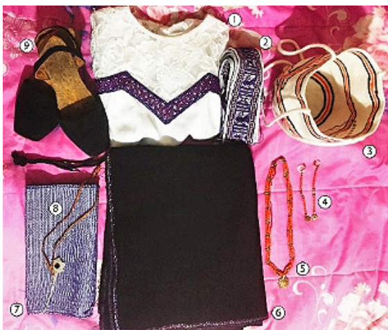
Figura 4. Vestuario femenino

Asimismo, el uso del chumbi (faja usada como cinturón) ha desaparecido y ha sido reemplazado por una correa de cuero. Las razones de esta modificación están vinculadas a la facilidad, la utilidad y el costo. Según indicaron los entrevistados, elaborar un chumbi es caro y usarlo, menos práctico. Además, a excepción de los ponchos, cada vez existen menos personas fabricantes de trajes a nivel local. También las alpargatas blancas han sido reemplazadas por el uso de zapatos de cuero de distinta fabricación. Pueden adquirirse alpargatas en la provincia de Imbabura, en la ciudad de Otavalo, pero es poco común que alguien las use.