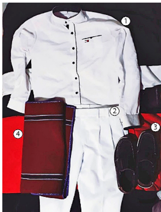
Figura 3. Vestuario masculino

1. Camisa, 2. Pantalón, 3. Zapatos, 4. Poncho