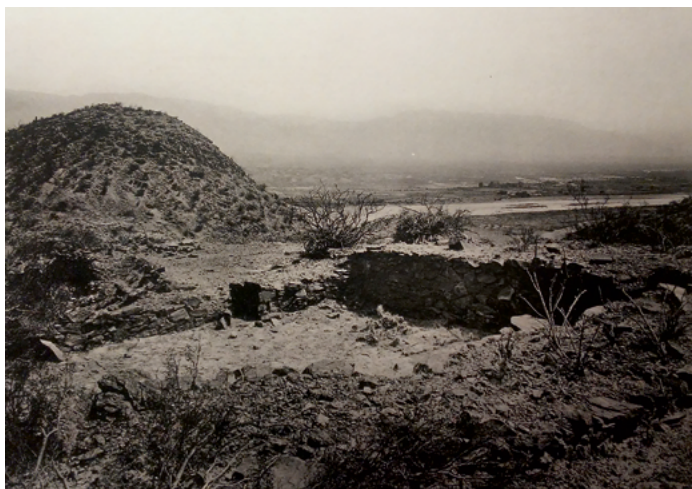
Figura 2. Fotografías del sitio arqueológico conocido actualmente como Cerro Colorado de La Ciénaga de Abajo.