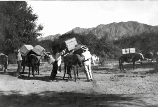
Arriba: fotografía N°1212; cajones con hallazgos listos para el transporte. Abajo: fotografía N°1214; se cargan las mulas en Belén.