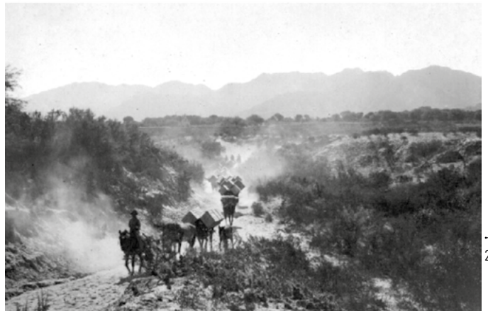
Arriba: fotografía N°1213. Abajo: fotografía N°1215.