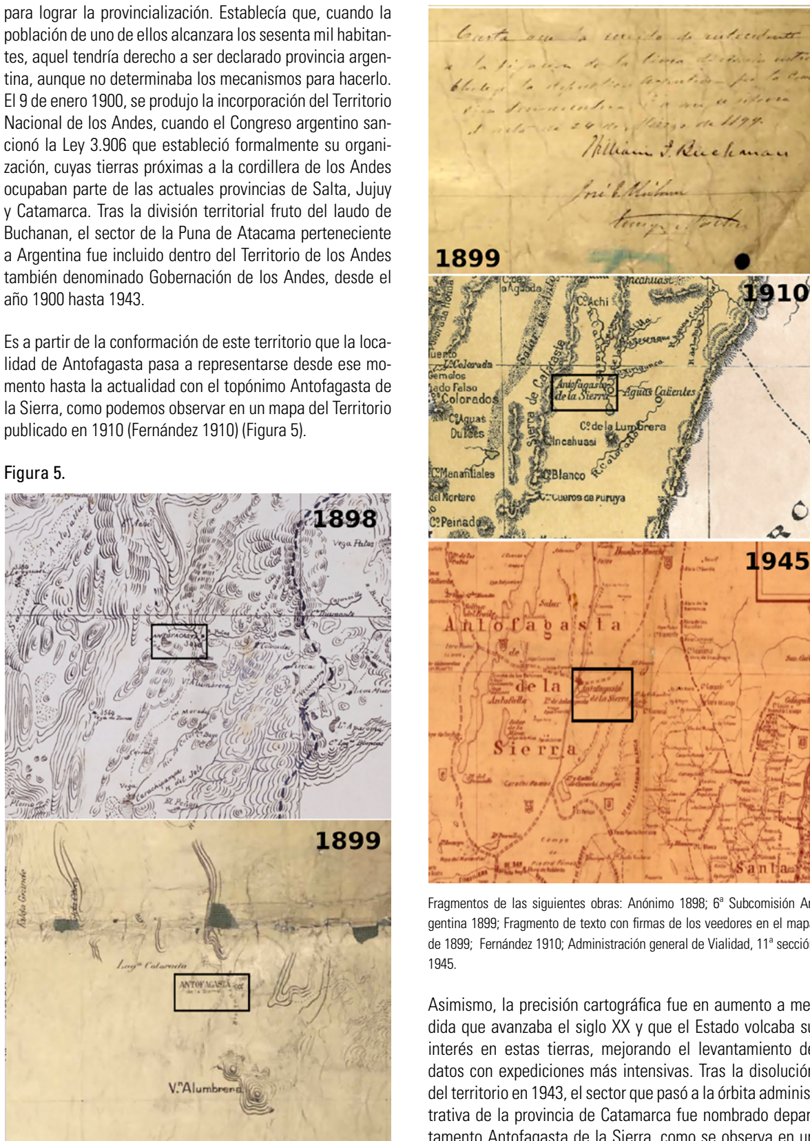
Fragmentos de las siguientes obras: Anónimo 1898; 6ª Subcomisión Argentina 1899; Fragmento de texto con firmas de los veedores en el mapa de 1899; Fernández 1910; Administración general de Vialidad, 11ª sección 1945.

Asimismo, la precisión cartográfica fue en aumento a medida que avanzaba el siglo XX y que el Estado volcaba su interés en estas tierras, mejorando el levantamiento de datos con expediciones más intensivas. Tras la disolución del territorio en 1943, el sector que pasó a la órbita administrativa de la provincia de Catamarca fue nombrado departamento Antofagasta de la Sierra, como se observa en un