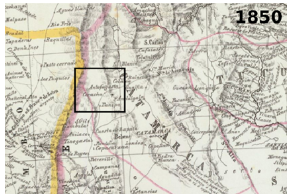
Fragmentos de mapas de las siguientes obras: Arrowsmith 1817; Weiland 1823; Fremin, Monin y Montemont 1837; Society for the Diffusion of Useful Knowledge 1840; Marzolla, Parrish y Arrowsmith 1850.

Sin embargo, en un mapa producido en 1840 por la Society for the Diffusion of Useful Knowledge (Gran Bretaña) 4 , el valle y/o río Antiosa no aparece expresado, pero las fronteras de Bolivia llegan unos kilómetros más hacia al norte de la localidad de Laguna Blanca, la cual sí está registrada (Figura 3). Se trata del primer mapa de los estudiados en el que se registra el sector de Atacama Alta (dentro de la que se encuentra el área de estudio) y Baja, incluida la faja de mar como parte de Bolivia.